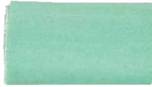
Material cu rol protector