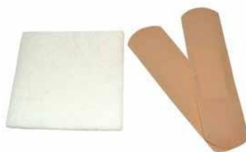
Plasturi și tampoane uscate (nu sunt incluse în ambalaj)