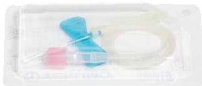
1 Set de puncție venoasă (branulă cu tub)