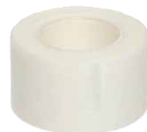
Leucoplast (nu este inclus în ambalaj)