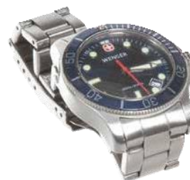
Ceas (nu este inclus în ambalaj)