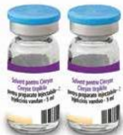
1 sau 2 Flacoane cu apă pentru preparate injectabile (solvent, 5 ml fiecare)