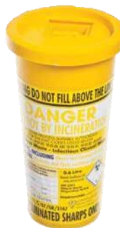
Container pentru obiecte ascuțite (nu este inclus în ambalaj)