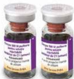
1 sau 2 Flacoane cu medicament Cinryze (inhibitor uman de C1-esterază) (500 UI fiecare)