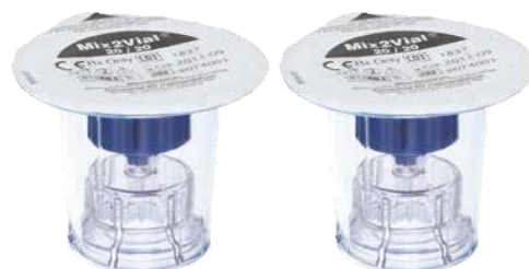
1 sau 2 Dispozitive de transfer