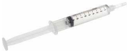
Medicament Cinryze (inhibitor uman de C1-esterază) dizolvat în seringă de 10 ml

Înainte de injectare, va trebui să aveți pregătite următoarele materiale: