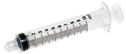
1 seringă de unică folosință de 10 ml